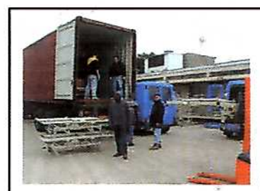
Hôpital Ch.Richet : des lits électriques pour Lomé

La réception des équipements fait l'objet d'une expertise par les médecins spécialisés de l'association et du choix des moyens logistiques à mettre en œuvre :