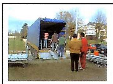
Hôpital de Briare : 147 lits Pour la Bulgarie

Le chargement des semi-remorques et des containers : il se fait à Viry ou directement chez les donateurs :