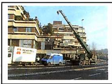
Manutention lourde - Pont de Suresnes Récupération d'une cuisine collective