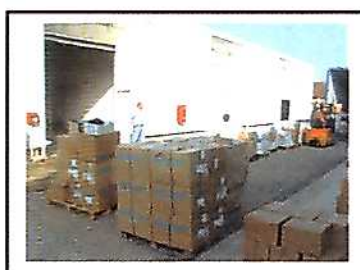
Viry : des livres pour l'Ambassade de France à Alger