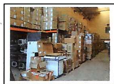
Stockage au dépôt de Nanterre

Le chargement des semi-remorques et des containers : il se fait à Viry ou directement chez les donateurs :