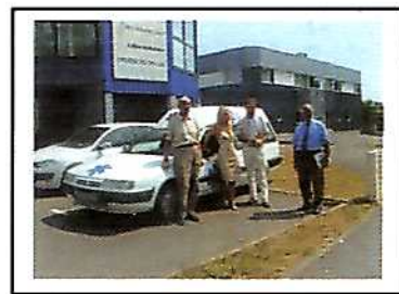
Don d'une ambulance pour les Comores - réception à Nancy