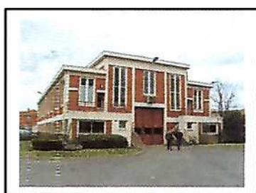
Vue extérieure de Nanterre