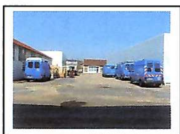
Stockage de Viry-Châtillon

Une convention signée entre l'association humanitaire du personnel de GDF, CODEGAZ et BIP, permet de disposer de locaux de stockage dans la Région parisienne et de véhicules de transport pour ses collectes d'équipements et consommables médicaux.